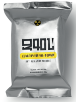
anti-radiation kit "ZGON"

Also, in order to effectively prevent radiation sickness, it is recommended to use black currant and sea buckthorn, which are capable of removing radionuclides from the body. And an infusion of rosehip or blueberry helps to eliminate cesium and strontium from the body.