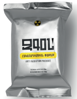
«ԶԳՕՆ» հակառադիացիոն փաթեթ

125 մգ (Kl 125 mg) նախատեսված է ճառագայթային աղետների ժամանակ վահանաձև գեղձը պաշտպանելու համար և այն չի թիրախավորում մարդու մարմնի մյուս օրգաններն ու հյուսվածքները: Օգտագործման եղանակը մանրա- մասնորեն նկարագրված է հակառադիացիոն փաթեթին կից ներդիր թերթիկում: